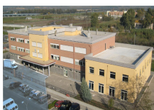
ISTITUTO COMPRENSIVO G.B. GRASSI